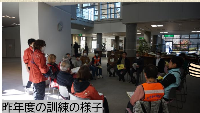
昨年度の訓練の様子